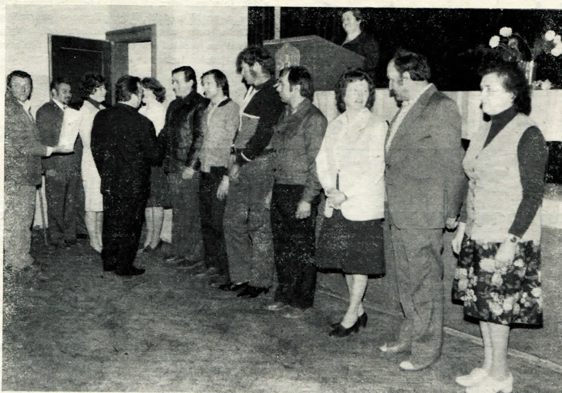
Ze slavnostního zasedání MNV 5. května 1982