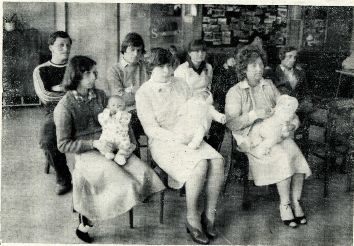
Z posledního vítání občánek